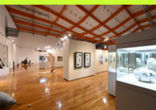
▲美術作品常設展示

第8回目の開催となる本展では、第7回展までの入賞作品を含む約50点の風景画作品を展示します。※1：名称に「私」の文字を追加し人が居る風景を積極的に募集するものとした。