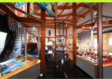
▲民俗資料常設展示