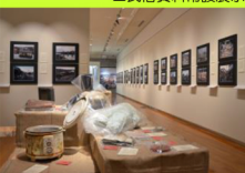
▲震災資料常設展示