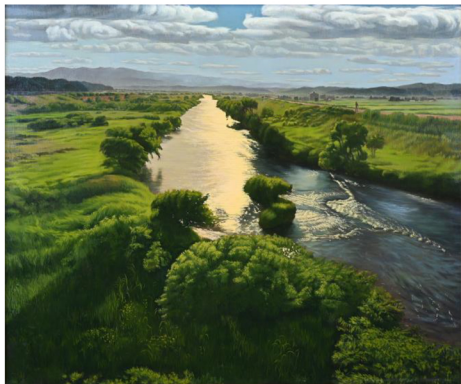
優秀賞「光、流れ、広がり」栗田智彦・油彩・F20